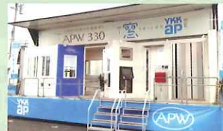
■移動展示車APW九州号

実際の商品を搭載した展示トラックが フェア会場にやってくる! 触って扱って、 使い心地をチェックできます。