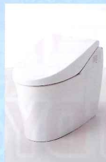
■レストルーム 「ネオレスト」「一体形GG」