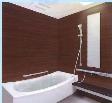
■システムバス「サザナ」