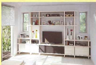
■システム収納「フィットシェルフ」