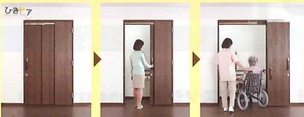
■狭小間口トイレドア「ひきドア」