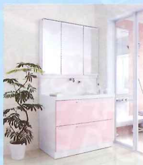
■洗面化粧台 「サクア」「オクターブ」