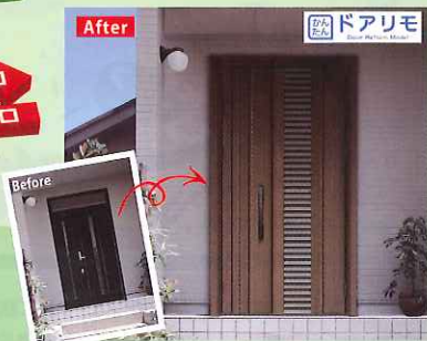
■かんたんドアリモ